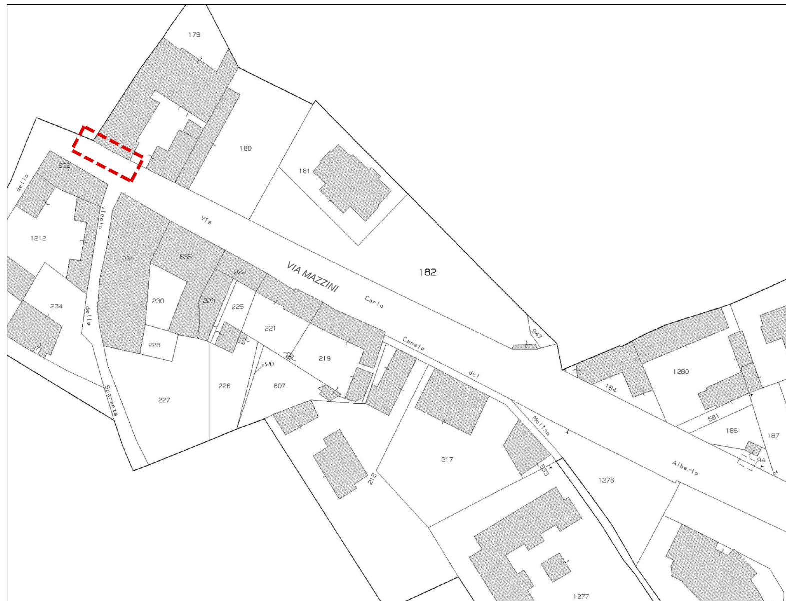
ESTRATTO MAPPA CATASTALE - FG. 7 scala 1:1000

destinazione d'uso: aree per la viabilità' (INTERVENTO 1) - spazi pubblici a attrezzature di interesse comune e istruzione (INTERVENTO 2 - INTERVENTO 3)