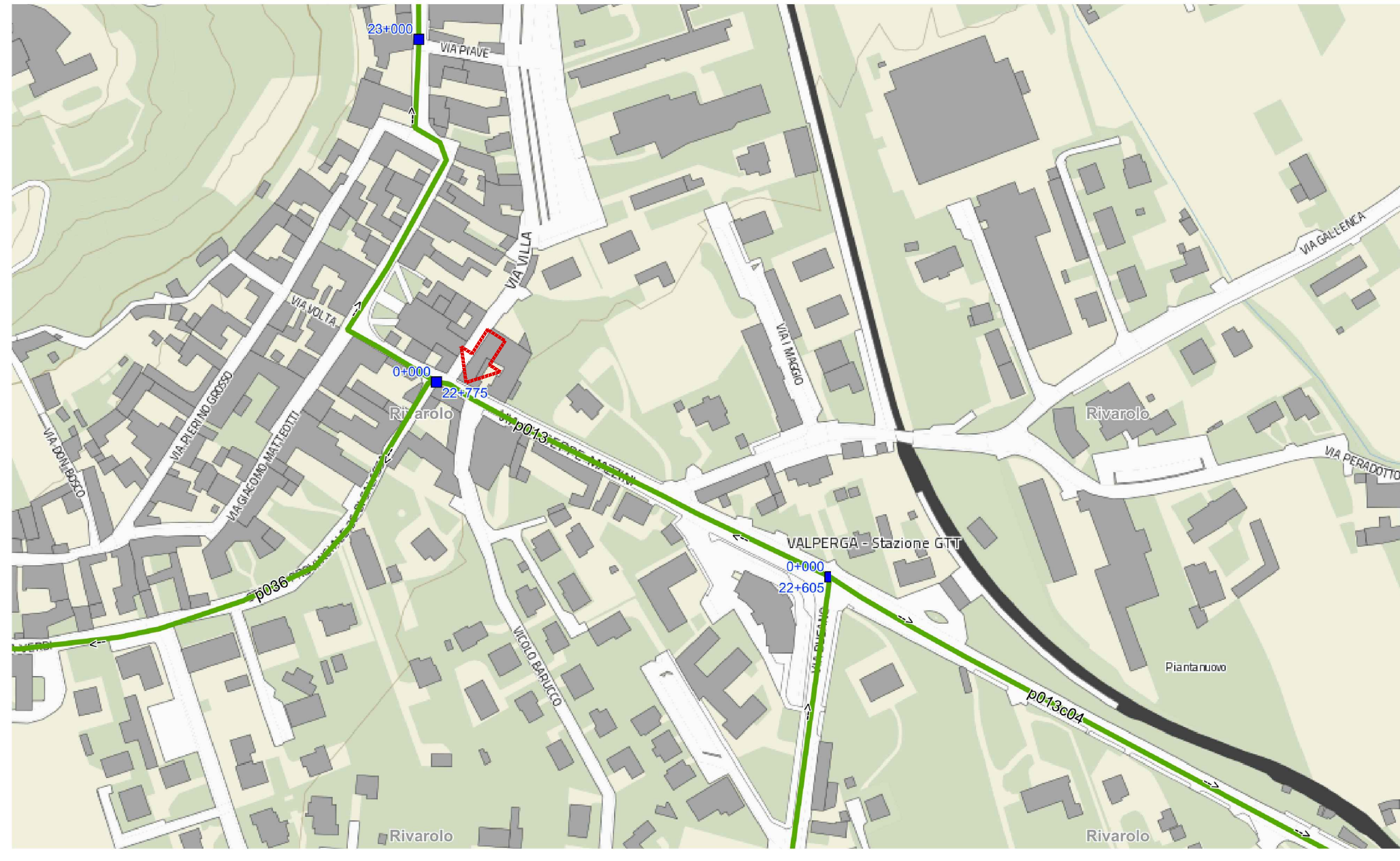
ESTRATTO STRADARIO INTERATTIVO CITTA' METROPOLITANA DI TORINO SP. 013 - COMUNE DI VALPERGA (intervento previsto al km 22+765)